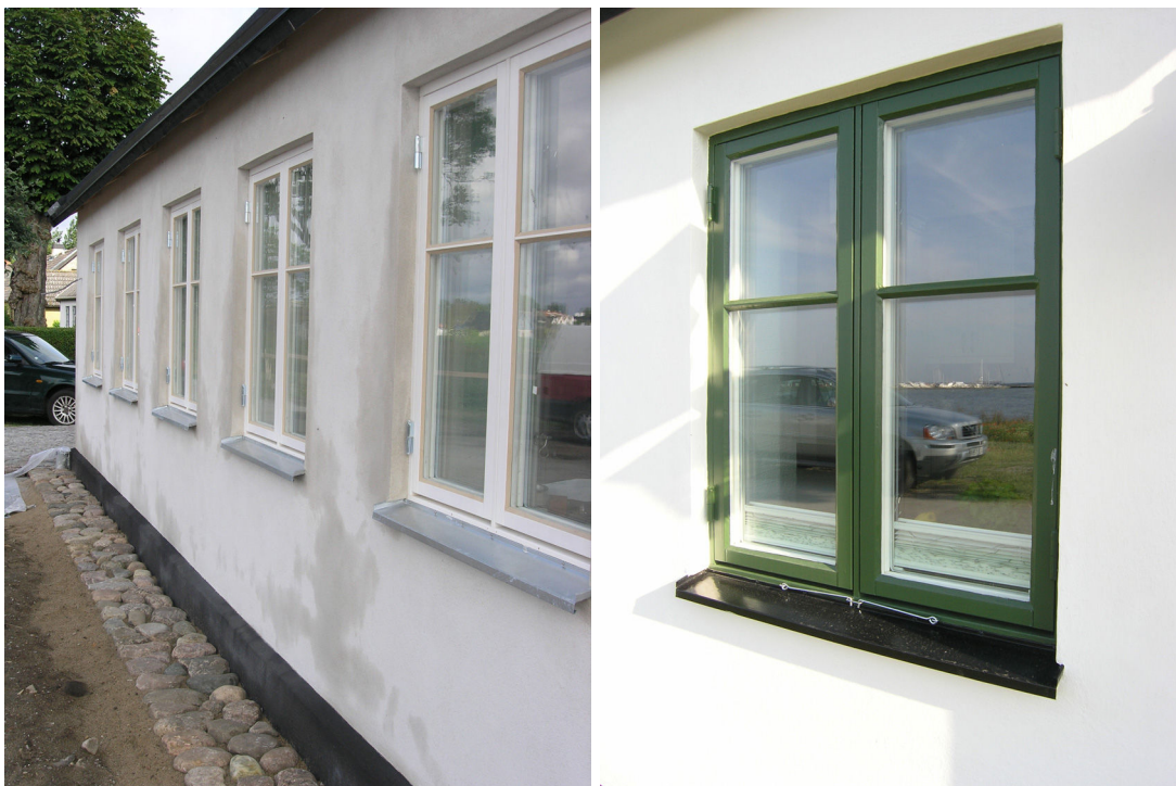
Till vänster gatufasad men nykittade och grundmålade fönster. Till höger detalj av fönster som målats med äkta linoljefärg i kulören "Köpenhamnsgrön" från Ottossons Färgmakeri.