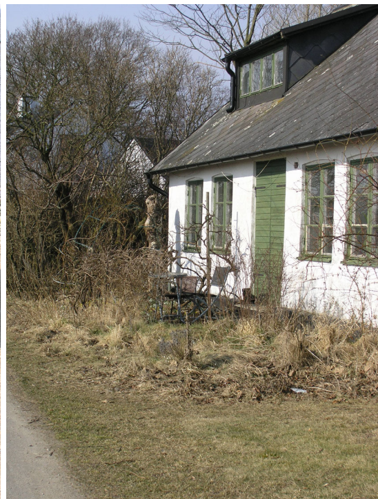
Till vänster detalj av ett av de värn som ingick i den så kallade Per Albin Hansson-linjen. Till höger ett av de mer orörda husen längs Vikbögs Ängaväg.