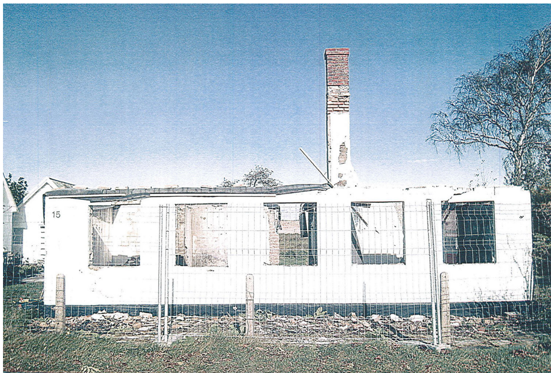
Husets status i samband med att stora delar rivits.

Kommunen utdömde ett vite och ställde krav på en rekonstruktion. I det läget kontaktades Regionmuseet av entreprenören. Företaget visade en vilja att vända det negativa som skett till något bra. Samtalet mynnade ut i ett uppdrag, med Regionmuseet som antikvarisk expert och ansvarigt för dokumentation av renoverings- och rekonstruktionsarbetet. För att säkerställa kontinuerlig dialog har flera byggmöten hållits. Även Kävlinge kommun har medverkat i olika byggmöten. Arbetet har genomgående kännetecknats av transparens och tydlig information till samtliga berörda parter. Museets medverkan har till stor del handlat om råd vid val av material och metod. Resultatet av processen blev ett rekonstruerat fiskarhus som kompletterats med en ny enplansbyggnad i vinkel samt ett friliggande garage. Tillbyggnaderna var redan beviljade i samband med rivningslov för byte av takmaterial.