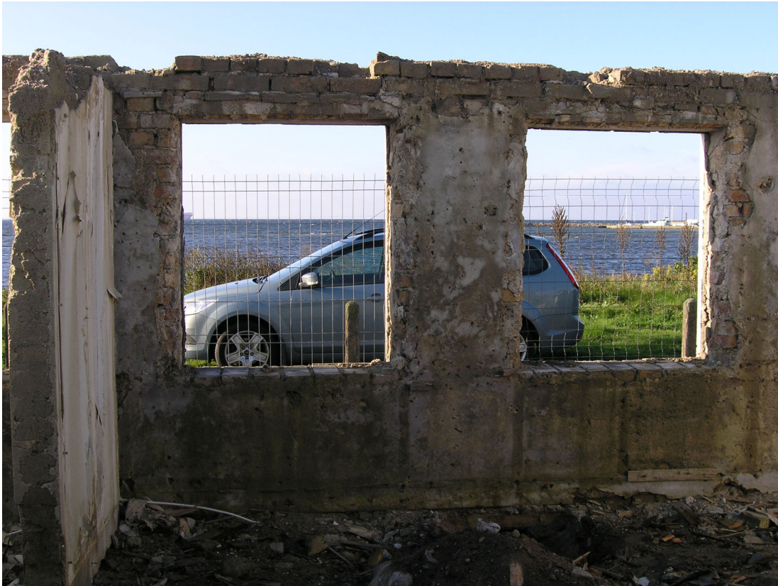
Interiörbild från huset på fastigheten Vikhög 2:22 strax efter att takkonstruktionen rivits och fönstren respektive dörrarna tagits bort.