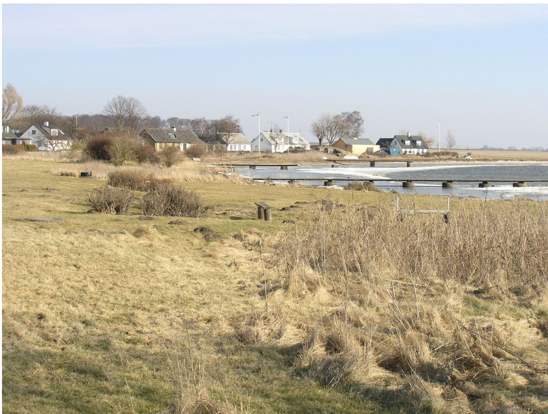
Miljöbild från Vikhög och den strandäng som till stor del präglar fiskeläget.