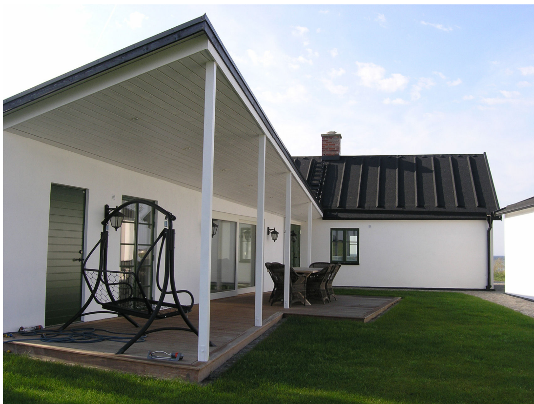
Tillbyggnaden och dess anslutning till ursprungslandet, sett från norr.