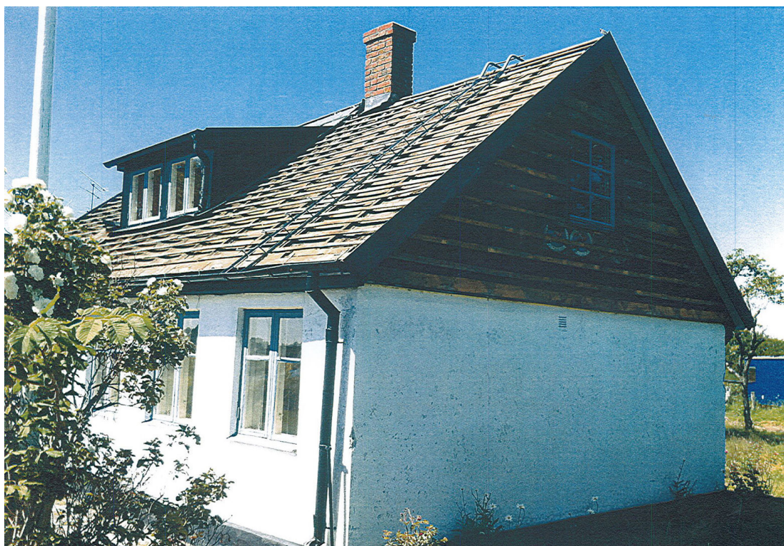
Vikhög 2:22 i början av renoveringen. Här har eternitplattorna på taket just tagits bort.