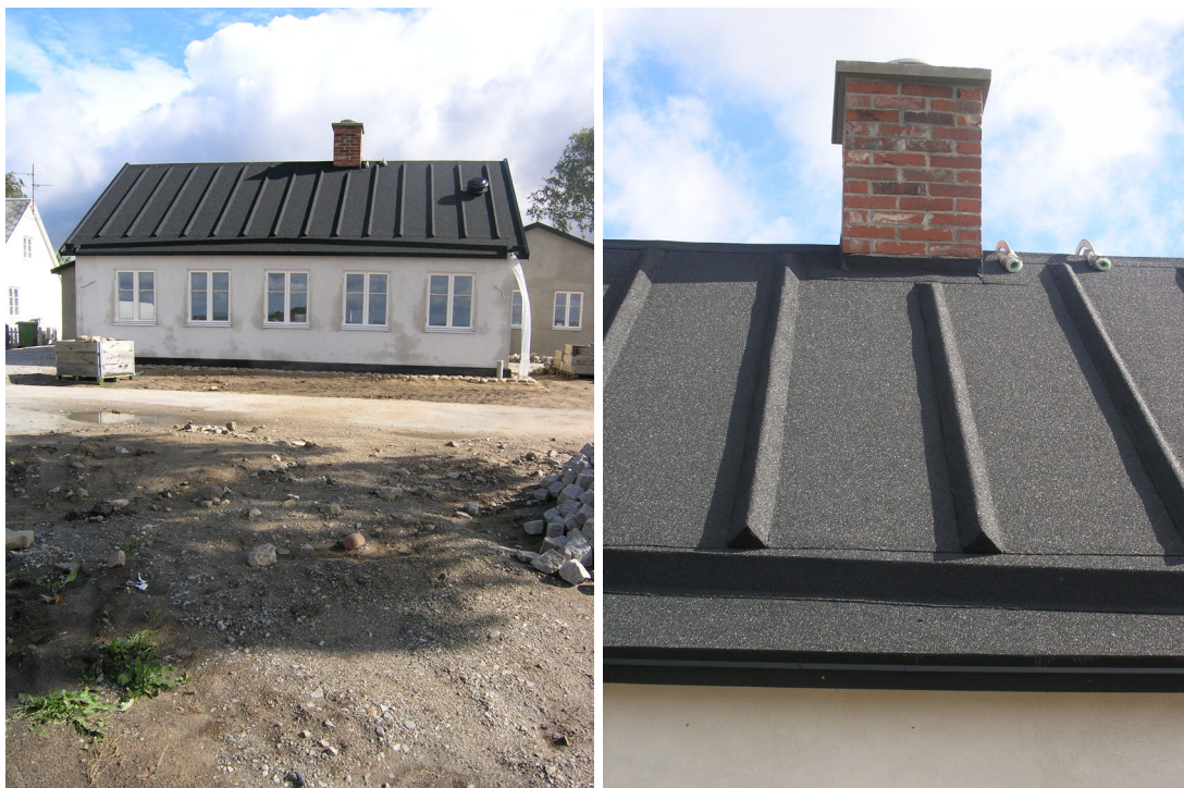
Bilder från pågående renovering. De togs i samband med ett byggmöte då takpappen var nylagd och utformningen av häng-rännor och stuprör diskuterades.