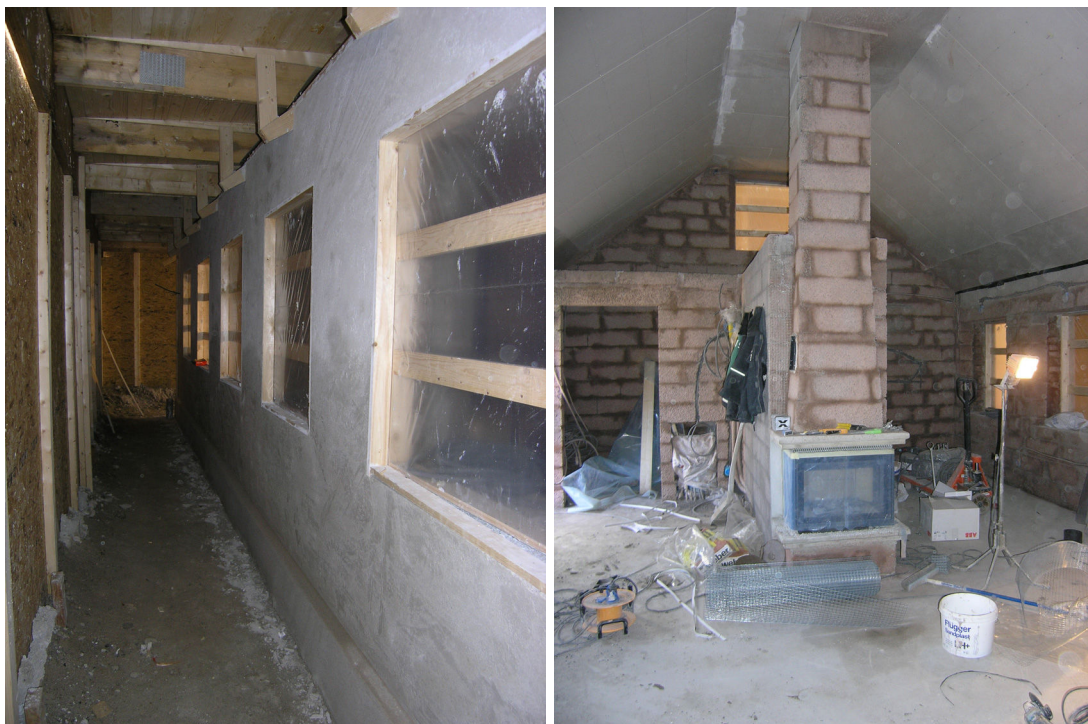
Till vänster nyputsad fasad. Till höger en interiör från ursprungslandet, där den tidigare rumsdispositionen med flera små rum ersatts av öppen planlösning.