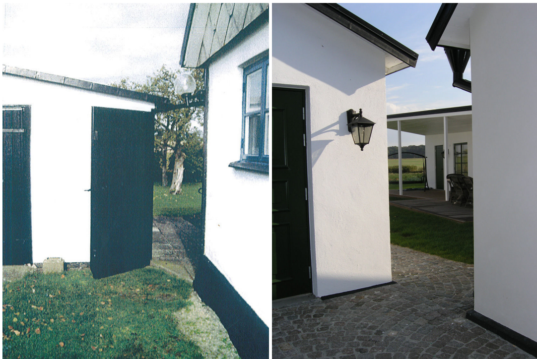
Till vänster äldre foto: Äldre garage och ursprungsbus. Till höger det nya garaget och ursprungsbuset. På innergården syns också tillbyggnaden.