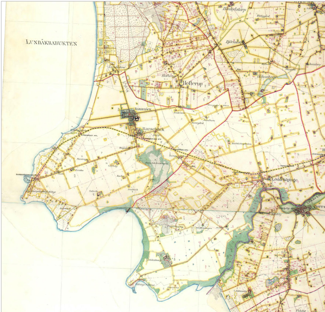
Del av häradskartan från 1910-talet, med Vikbögs fiskeläge på den nedre udden. I kartans högra del syns Löddeköpinge.