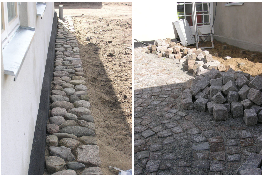
Till vänster kullersten längs med husets södra fasad. Till höger läggning av gatssten på platsen ut mot Vikhögs Ängaväg, mellan ursprungshuset och tillbyggnaden.