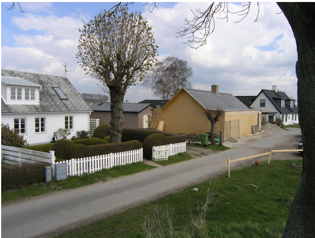
Vy längs med Vikhögs Ängaväg, österut från hamnen sett.