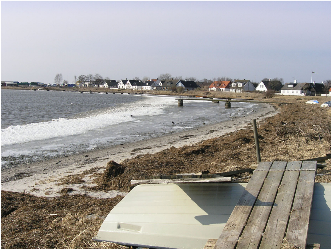
Vy från Vikbögs östra del västerut mot hamnen.