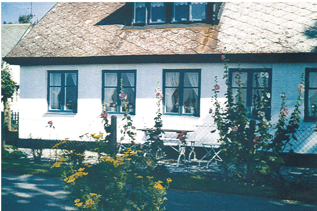
En äldre bild av huset på fastigheten Vikbög 2:22.