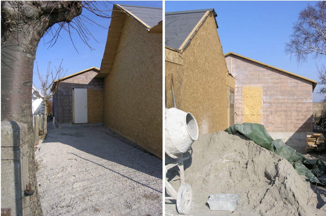
Bilder från återuppbyggnaden, då huset hade ett skalskydd för att skydda murverket samt att möjliggöra arbete oberoende av väder.