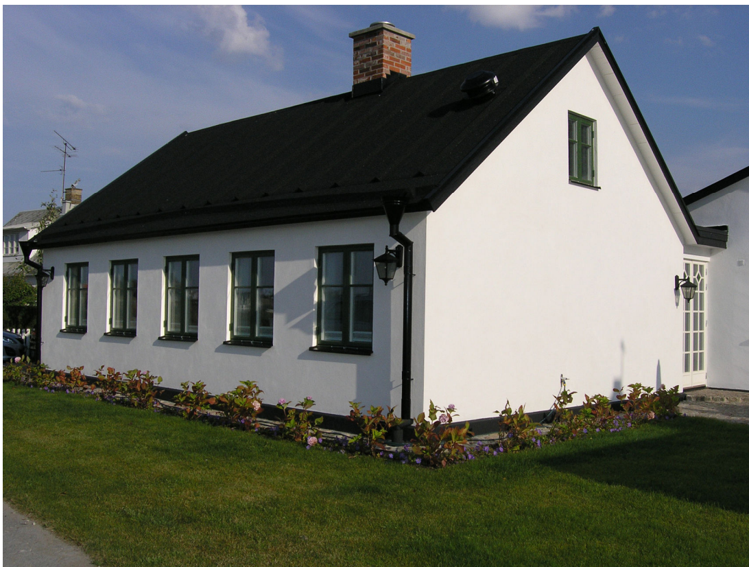
Arbetet är klart. Gräsmattan har rullats ut och rabatten längs med husets södra fasad har försetts med nytt växtmaterial.

Huset på fastigheten Vikhög 2:22 är förändrat men förändringarna som gjorts, i samband med rekonstruktion och tillbyggnad, tar hänsyn till karaktärsdragen för Vikhögs fiskeläge. Regionmuseet anser att entreprenören, mot många odds, lyckades vända en mycket negativ situation till något som i slutänden blev riktigt bra. Trots det goda slutresultatet, hoppas vi att denna dokumentation bidrar till en ökad dialog i processen kring rivningslov och att situationer som den i Vikhög därmed undviks.